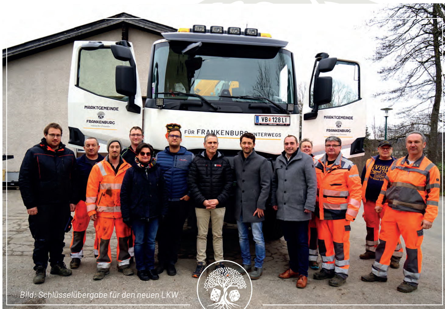
Bild: Schlüsselübergabe für den neuen LKW

Zum ersten Schnee im Dezember kam der neue LKW des Bauhofs gerade recht und jetzt hat er sich bereits bewährt. Auf über 120 km Frankenburger Gemeindestraßen ist der LKW der Marke Renault unterwegs.